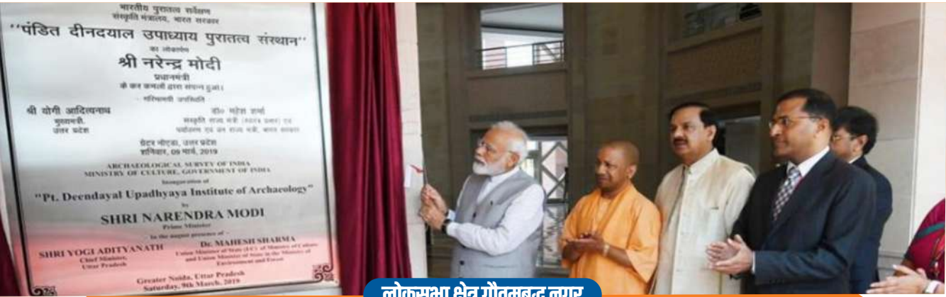
लोकसभा क्षेत्र गौतमबुद्ध नगर

पं. दीनदयाल उपाध्याय पुरातत्व संस्थान की स्थापना।