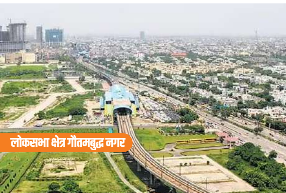
लोकसभा क्षेत्र गौतमबुद्ध नगर

जिसमें बीज बैंक, जीन बैंक, हर्बेरियम इकाई और सौंदर्यीकरण को बढ़ाया गया।